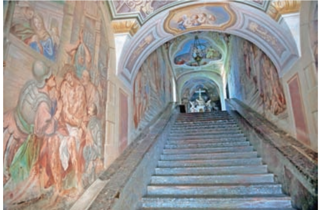
»Svete štenge« na Svetem Joštu iz leta 1751 z 28 stopnicami so ene od treh takšnih svetih stopnic na Slovenskem.

Sveti Jošt nad Kranjem je bil v 18. stoletju »gora romarjev«, ki so častili zavetnika Svetega Jošta, sveto Ano in svetega Andreja. Ustanovljeni sta bili bratovščini Svetega Jošta in Svete Ane. Romarji gore niso obiskovali le ob nedeljah in praznikih, ampak tudi ob delavnikih, ko je bilo darovanih tudi do dvajset maš. Letno pa je bilo opravljenih okoli dva tisoč maš, več kot petdeset tisoč romarjev pa je prejelo obhajilo. Za romarje je skrbelo tudi poosem,