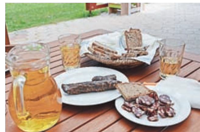
Domači mošt (jabolčnik), suhe klobase in črni rženi kruh – to je »ta prava koroška mavžna.« Turistične kmetije na Strojni in Komlju jih pripravljajo svojim gostom.

odprli tam uto, na kolesa navili cunje in po polju brizgalno pripeljali nazaj v Libeliče. Zaradi te brizgalne je nastal spor med vaščani in sorodniki na tej in oni strani meje. »Zamere pa niso trajale dolgo. Ko je leta 1925 bil v Libeličah požar, so bili Poto-