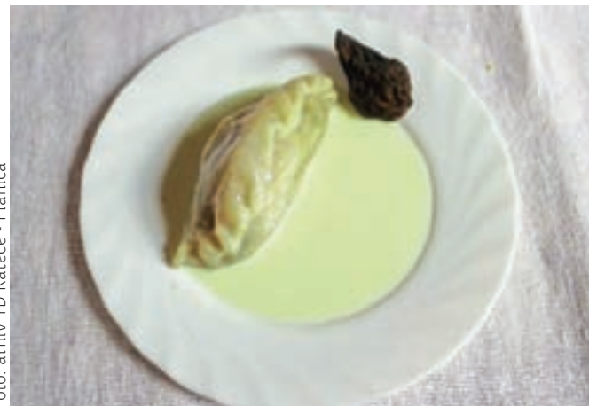
Rateški kôcavi krapí imajo nadev iz zmletih suhih hrušk tepk. Tem v Ratečah pravijo kôce.

izvajajo kuharske delavnice, na Jesenicah povezujejo gostince z oblikovanjem skupnega menija Delavska malca, v Radovljici pri izvedbi delavnic zelo uspešno sodelujejo z Društvom žensk z dežele občine Radovljica ... Upajo, da bo v prihodnosti še v kakšnem kraju izšla podobna knjiga, kot je Rateška košta.