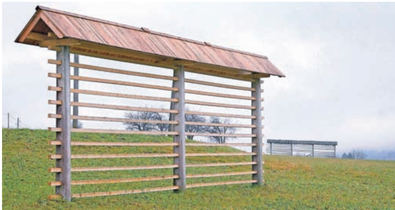
Kozolci so naša dediščina

Na osnovi popisa so izdelali etnološko karto kozolcev, iz