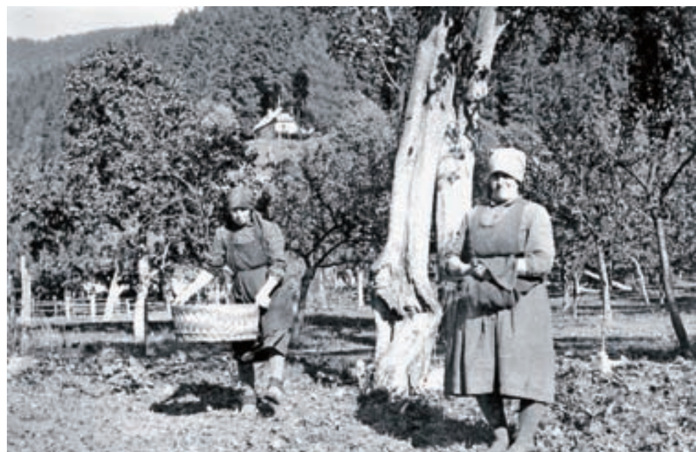
»Ratešci« med pobiranjem sadja. V Ratečah so vselej najbolj obrodile hruške in jabolka.

Priprava: Iz mešanice moke, jajc, vode in soli naredimo vlečeno testo in ga razvaljamo. Po njem premažemo nadev iz skute, jajc, soli in sladkorja. Zavijemo v krpo in približno 15 minut kuhamo v kropu. Zabelimo z drobtinami in po želji sladkamo. Danes nekateri čez nadev potresejo tudi rozine. Štruklje so jedli poleti na polju. Nekateri so jih jedli s kompotom ali čežano, drugi pa tudi z zeleno ali zelnjato solato. Ime so dobili iz besede poviti (pabíta), ker so med kuho poviti oziroma zaviti v krpo.