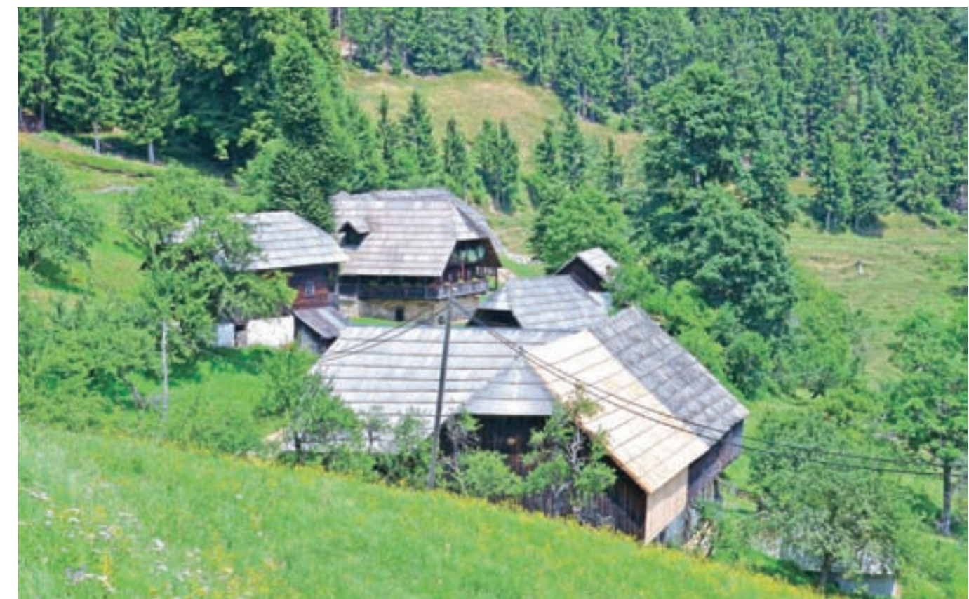
S spomeniškim varstvom zaščiten Janeževa domačija na Strojni je stara okoli štiristo let in ohranja tradicionalno arhitekturo.