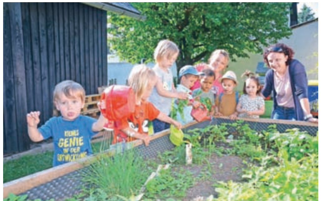
V otroških jaslih Mohorjeve družbe v Slomškovi hiši že najmlajši skrbijo za svoj vrt.

Še pred tem je skupina staršev vložila na avstrijskem ustavnem sodišču tožbo za javno dvojezično ljudsko šolo v Celovcu. Ker potrebe po njej ne nazadnje zaradi ustanovitve zasebne Mohorjeve ljudske šole ni bilo več mogoče zanikati, je ustavno sodišče tožbi ugodilo in leta 1991 je končno lahko odprla vrata javna dvojezična osnovna šola (od 1. do 4. šolske stopnje) v Celovcu – znana kot ljudska šola 24. Obe, Mohorjeva ljudska šola in LŠ 24, veljata za izjemno kakovostni ustanovi, otroci se tam zares dobro naučijo slovenščine, temu primerno je tudi zanimanje zanj.