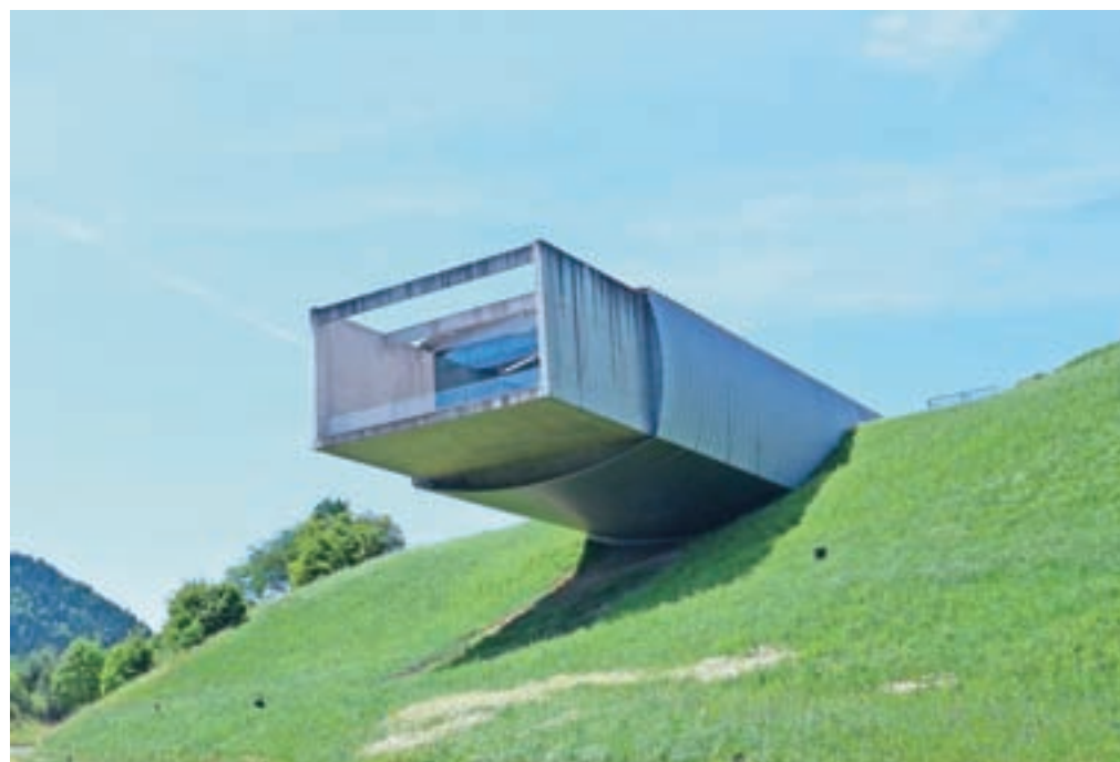
Muzej Liaunig z nagrajeno arhitekturo je ena največjih zasebnih in javno dostopnih zbirk sodobne umetnosti v Avstriji.