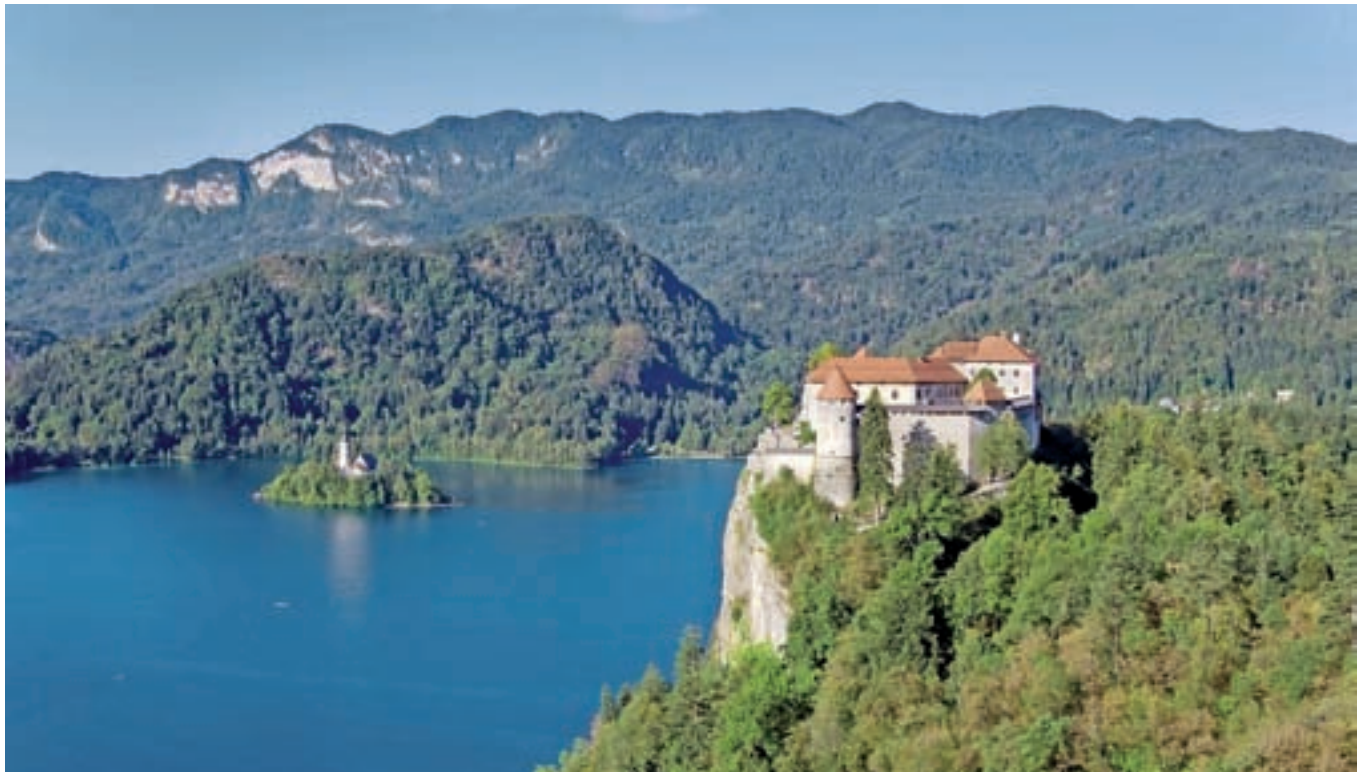
Blejski grad kraljuje na strmi pečini, ki se dviga 139 metrov nad gladino Blejskega jezera.

Med drugo svetovno vojno je bil grad močno poškodovan. »Leta 1951 se je začela njegova desetletna prenova pod vodstvom arhitekta Antona Bitenca, Plečnikovega učenca. Na gradu je ves čas obnove tudi živel in osebno nadzoroval dela,« je pojasnil Završnik. Po prenovi so ga odprli za obiskovalce. »Turizem in grad sta bila vedno zelo tesno povezana; počasi je grad dobil status znamenitosti, ki jo moraš obiskati, ko si na tem območju.« Od leta 1961 so po Završnikovih besedah na gradu ponujali zgolj klasične vsebine – muzej, gostinsko ponudbo in razgled. »Po letu 1996 se je več pozornosti začelo namenjati tudi dodatnim vsebinam, a dejstvo je, da prvi in najmočnejši motiv za obisk gradu še vedno ostaja razgled na celotno okolico.«