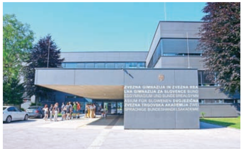
Slovenska gimnazija in dvojezična trgovska akademija kot osrednji slovenski izobraževalni ustanovi v Celovcu domujeta v skupnem poslopju.