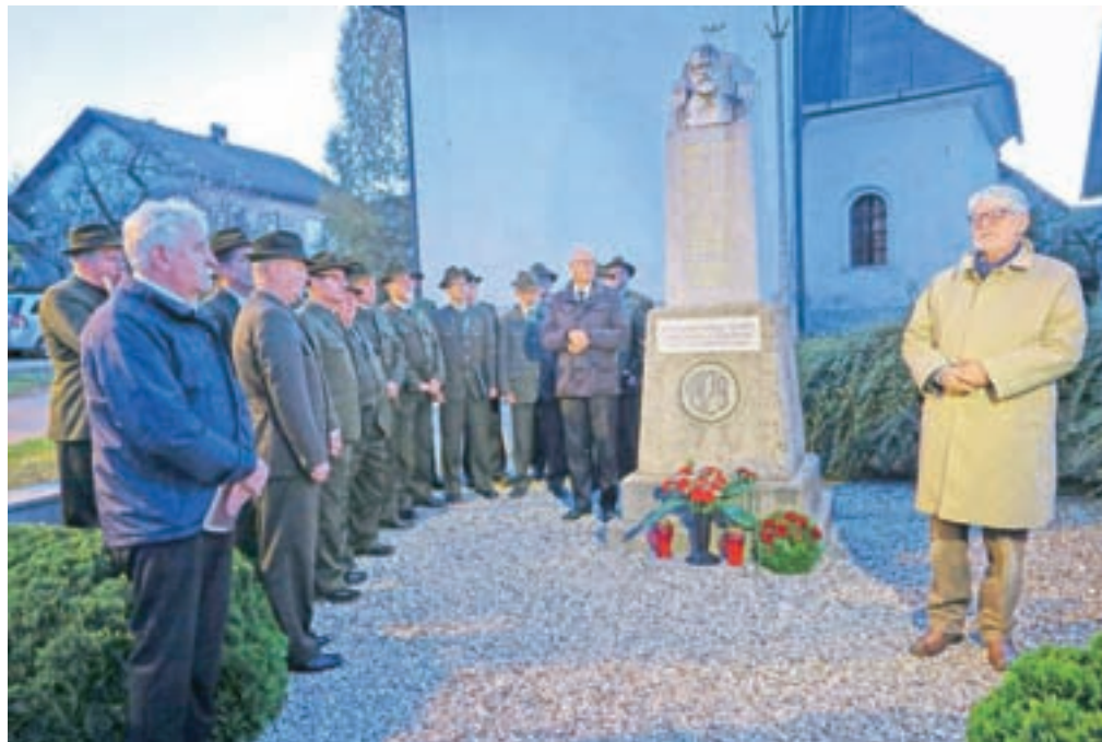
V zadnjih letih se slovesnost ob podelitvi Jenkove nagrade začne ob spomeniku Simonu Jenku v njegovem rojstnem kraju Podreča.