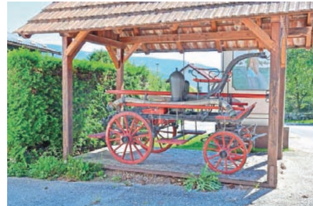
Znamenita brizgalna, ki so jo naprej odnesli Potočani Libeličanom, na koncu pa so jo ti spet »ugrabili« nazaj.

Že v dolini, na vzhodnem vnožju Komeljskega hribovja, so Libeliče v občini Dravograd. V slovensko zgodovino so se zapisale z dveh letnih bojem, da naj zanje obvelja krajevni rezultat glasovanja na koroškem plebiscitu iz leta 1920, ne izid celotne cone A. V Libeličah se je za Jugoslavijo odločilo 57 odstotkov glasovalcev. »Vsak dan so ruvali mejnike, rezali bodočo državno žico,