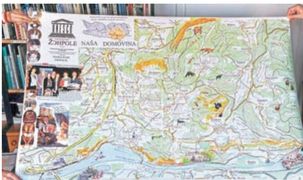
Eden od zemljevidov s slovenskimi ledinskimi imeni Žihpolja na avstrijskem Koroškem

Zbiranje hišnih in ledinskih imen pa se na obeh straneh Karavank še nadaljuje.