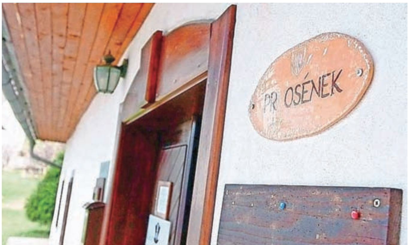
Tablice s starimi hišnimi imeni na Gorenjskem

Pri zbiranju hišnih imen so že pred leti vzpostavili tudi čezmejno sodelovanje s