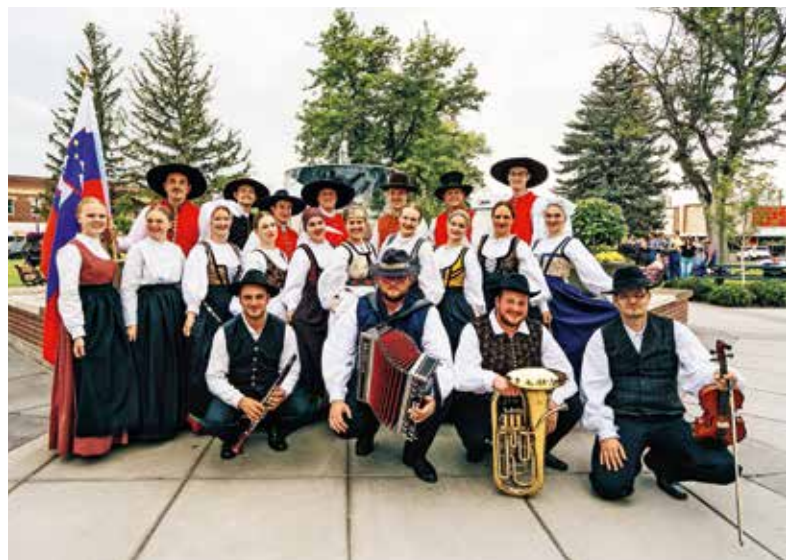
Ozarčani na gostovanju v ZDA, dekleti na levi sta bili njihovi vodički.

Ozarčani smo v tem času že začeli sezono, v kateri snujemo kup novih projektov, pogledi pa nam uhajajo na zemljevid, saj že iščemo destinacijo za novo poletno dogodivščino.