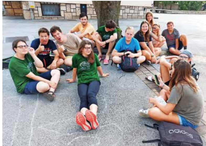
Kar 13 animatorjev je aktivno sodelovalo od zgodnjega jutra do večera.

Program smo popestrili z obiskom čarodeja Jana, izletom v Arboretum Volčji Potok, obiskom članov Lokostrelskega kluba Kranj, pomerili smo se na gasilskem poligonu, ki so ga za nas pripravili mladi člani PGD Kranj Primskovo. Veliko veselja je povzročila tudi vodna prha, s katero so nas navdušili gasilci. Z organizacijo dogodka se prostovoljci ukvarjamo že več mesecev prej. Potrebnih je veliko priprav, odločitev o programu, učenje vlog za igro in še mnogo majhnih zadev, ki na koncu povežejo vse niti v odličen dogodek. Letošnja posebnost? Zagotovo veliko mladih animatorjev – večinoma devetošol-