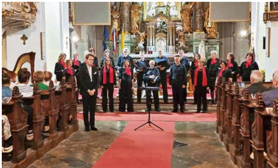
Koncert Povežimo bregove v Stražišču

violinist so bili za uvod v enourni koncert slovenskih pesmi, ki se jih kar niso hoteli naposlušati. Ko smo zaključili še s škotsko pesmijo Loch Lomond in dodali še njihovo tradicionalno Auld lang syne, je bila dvorana na nogah. Naslednji koncert je bil v katedrali manjšega obmorskega mesta Dornoch. Že samo prizorišče tamkajšnjega koncerta je bilo veličastno, poslušalci so bili sicer bolj zadržani, kot se za prireditveni prostor tudi spodobi, pa vendar nič manj prisrčni in ravno tako veseli naše pesmi. Zadnji koncert je bil v prireditve-