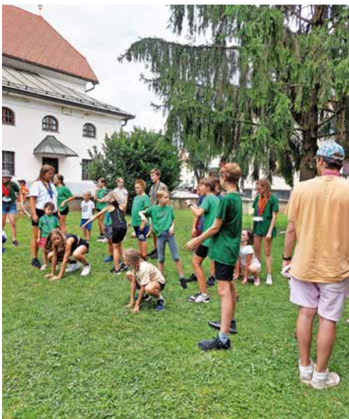
Otroci so že obljubili, da se avgusta prihodnje leto spet srečamo.